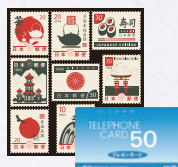
切手・テレホンカード