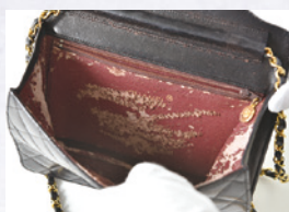
ベタベタ、壊れたバッグ