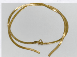
切れたネックレス