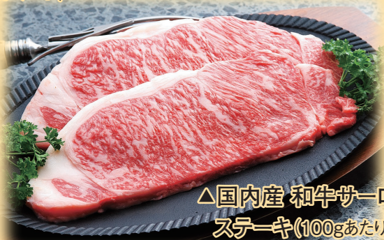
△国内産 和牛サーロイン ステーキ(100gあたり)